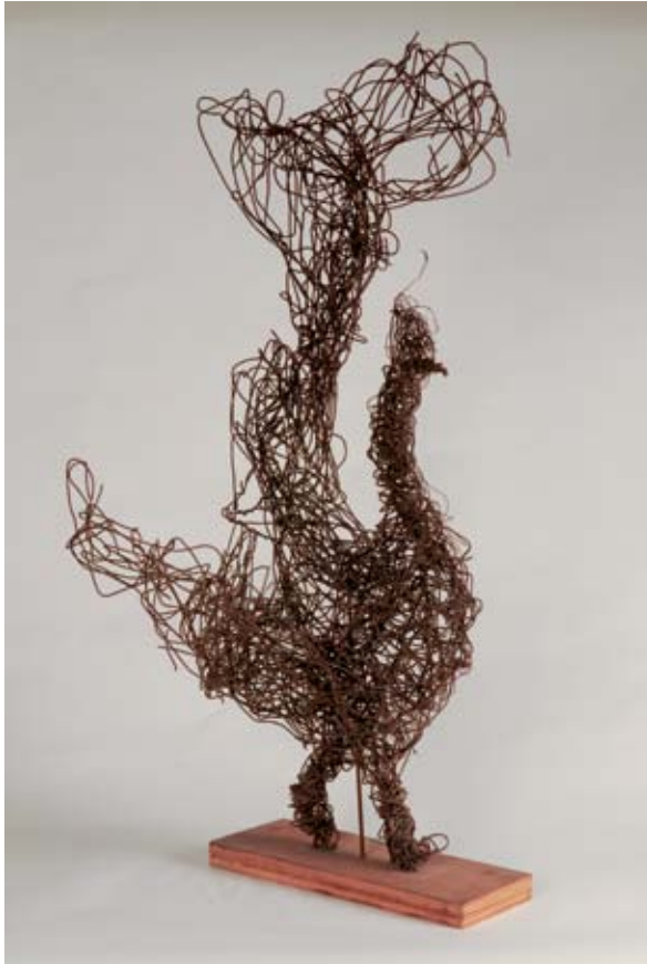
Grand Coq (sur socle), vers 1955 Fil de fer, bois - 64,0 x 55,0 x 31,5 cm