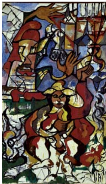
Don Quichotte et Sancho Pansa , vers 1960 Huile sur toile - 183,0 x 102,0 cm