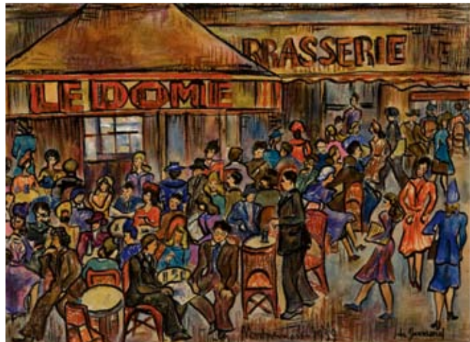
Montparnasse 1939 Encres de Chine - 38,5 x 55,0 cm