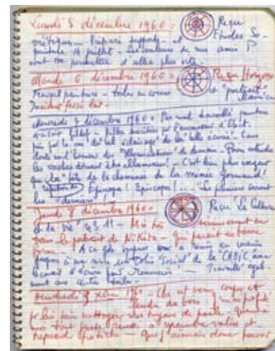
Journal de jour, décembre 1960