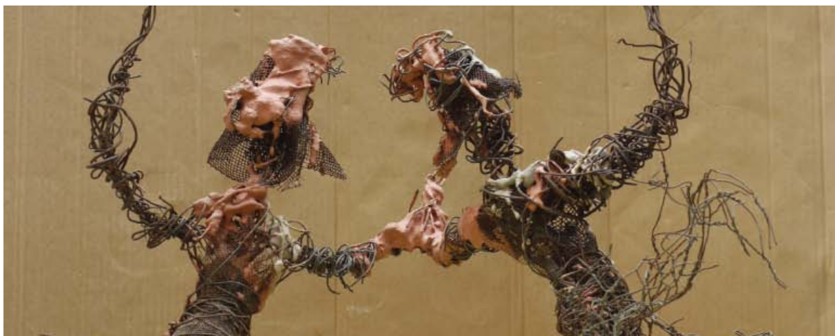
Les danseurs, vers 1955 Fil de fer, tissus - 64,0 x 55,2 cm

L'Artiste en colère, « déchirée entre le politique et le divin », crée intentionnellement des œuvres primitivistes faites de matériaux récupérés ou fabriqués : assemblage de toiles découpées dans des draps ou dans les sacs de toile de jute, échantillons de papier peint pour la peinture, montage sommaire des châssis, fil de vigne, ciment et fossiles pour la sculpture, constituent ses moyens rudimentaires d'expression.