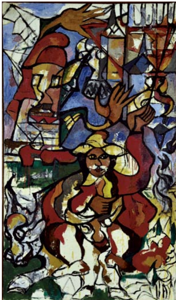
Don Quichotte et Sancho Pansa, vers 1960 (détail) Huile sur toile - 183,0 x 102,0 cm

Johé Gormand meurt le 24 janvier 1963 dans sa maison de Toury.