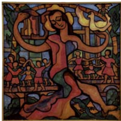
La Ronde de la Paix , vers 1955 Huile sur toile - 145,8 x 145,5 cm