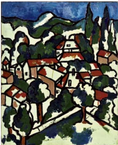
Toury, vers 1960 Huile sur toile - 65,0 x 53,5 cm

A la fin des années 30 , elle semble profiter de l'émulation intellectuelle de Montparnasse et participe à l'ambiance festive. En témoignent de nombreux dessins réalisés à l'encre dont l'un est daté de 1939.