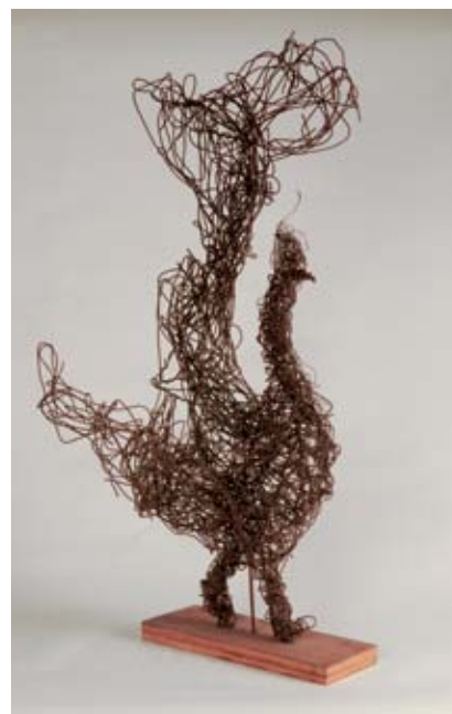
Grand Coq (sur socle), vers 1955 Fil de fer, bois - 64,0 x 55,0 x 31,5 cm