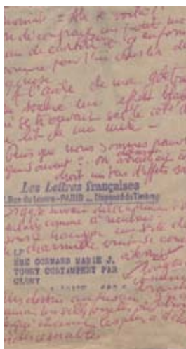
Rêve (de mardi à mercredi)

« Je sens vivre en moi un grand espoir... comme si j'attendais quelque chose d'heureux » confie-t-elle dans son « Journal de jour ».