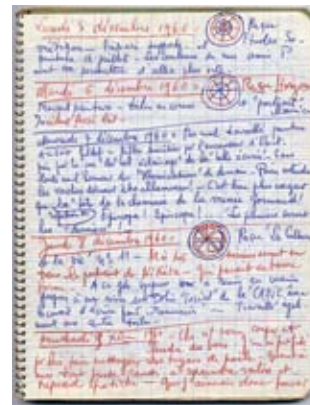
Journal de jour , décembre 1960