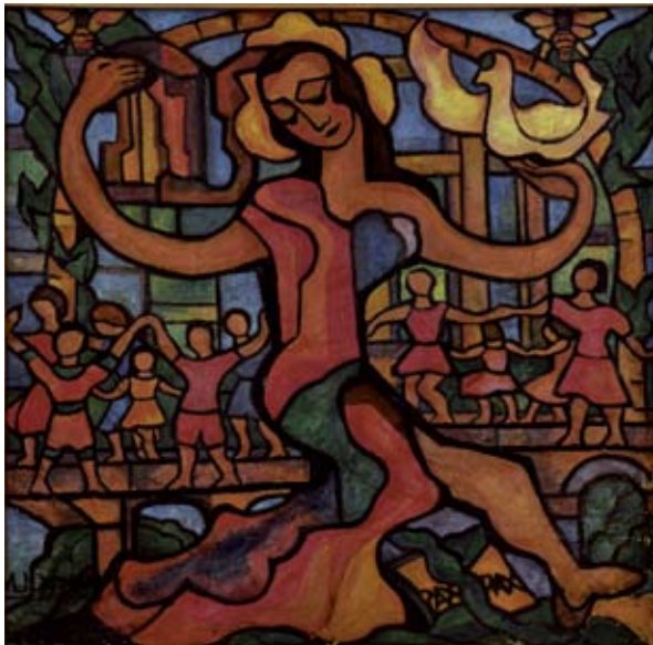
La Ronde de la Paix , vers 1955 Huile sur toile - 145,8 x 145,5 cm